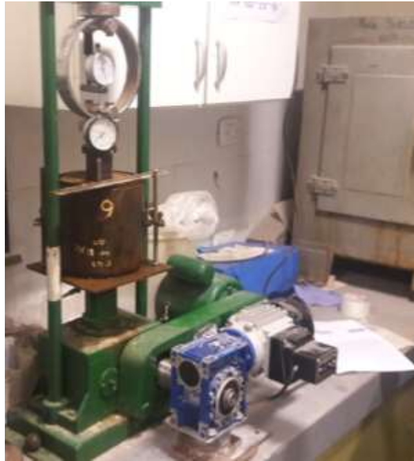
Figura 2. Ensayo de VSR

Una de las formas de evitar tal pérdida es la de instrumentar modelos que permitan arribar con cierta confiabilidad, mediante la aplicación de ensayos convencionales más al alcance de la ingeniería vial a nivel regional, a las constantes k_1, k_2, k_3 siendo este el motivo principal que llevó a los profesionales del LEMaC al desarrollo de las tareas que se presentan en este trabajo técnico, constituyendo una primera comunicación en tal sentido.