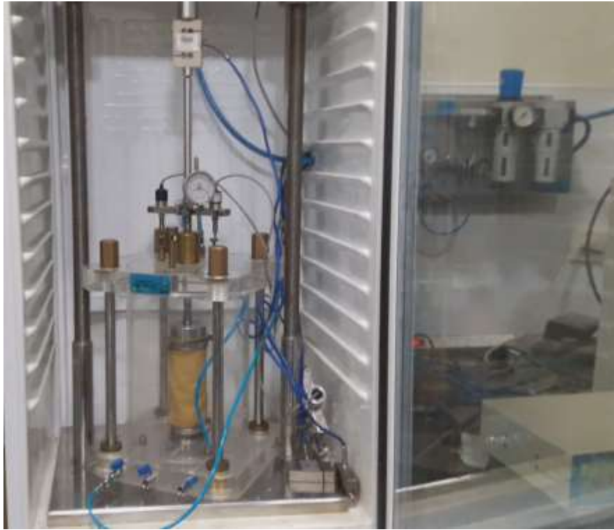
Figura 1. Parte del equipamiento necesario para determinaciones de M_r

No obstante estos conceptos y la normativa existente llevan varios años desde su desarrollo, en el medio local no han logrado insertarse de la forma que sería esperable, dado el significativo avance conceptual que implican. Como prueba de esto basta decir que, al menos en el conocimiento de los autores, sólo existen en el país 2 equipos que permitirían efectuar el ensayo, contándose con datos de que en muchos de los restantes países latinoamericanos no se cuenta con ningún equipo en funcionamiento.